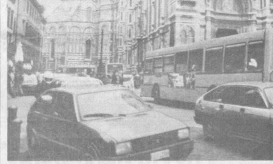
Этот город в центре Италии на реке Арно — административный центр провинции Флоренция и области Тоскана. Важный экономический, политический и культурный центр. Флоренция — один из красивейших городов мира, богатый выдающимися архитектурными памятниками.

ПО ГОРОДАМ И СТРАНАМ Этот город в центре Италии на реке Арно — административный центр провинции Флоренция и области Тоскана. Важный экономический, политический и культурный центр.