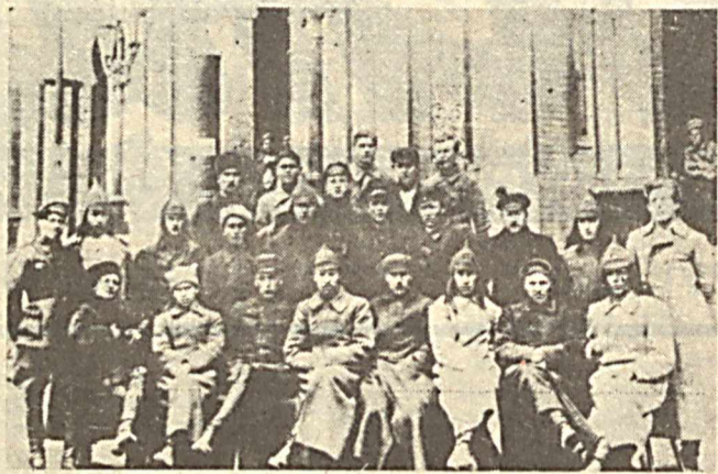
Работники милиции Ташкента перед отправкой на фронт. Осень 1941 года.