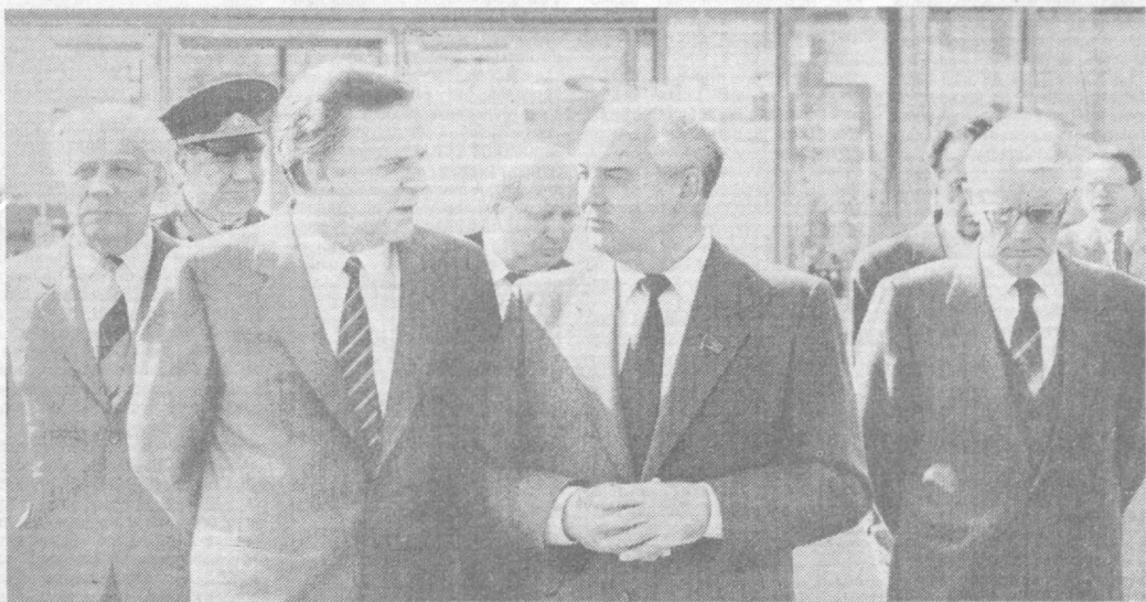
Во время проводов на аэродроме.

Выходит 300 раз в году • № 113 (21979) • Вторник, 16 мая 1989 года • Цена 3 коп.