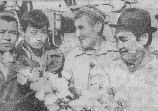
Коммунистлар мусобақата бошчилик қилмоқдалар