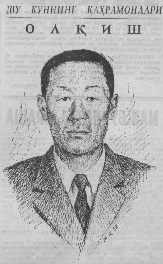
Дарё сувини баҳор тоштиради, инсон қадрини меҳнат оширади...