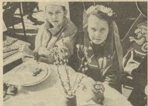
На снимках фрагмент масленицы, проходившей в Бантэровском районе Ташкента.