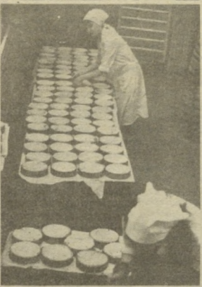
— А как все соединяется? Хотя один рецептик — женщинам, к 8 Марта.