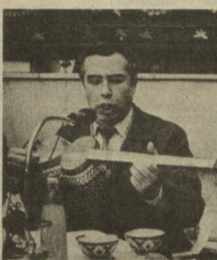
ТАШКЕНТ. На улицах и площадях города звучит музыка, дымится котлы с аппетитными восточными яствами. На лицах и взрослых, и малышей светятся улыбки. Люди рады весне, рады Наврузу. То и дело из уст а парадается: «Вайрам билан С праздником!»