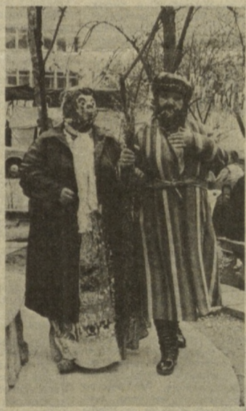
На снимках: ташкентцы празднуют Навруз.