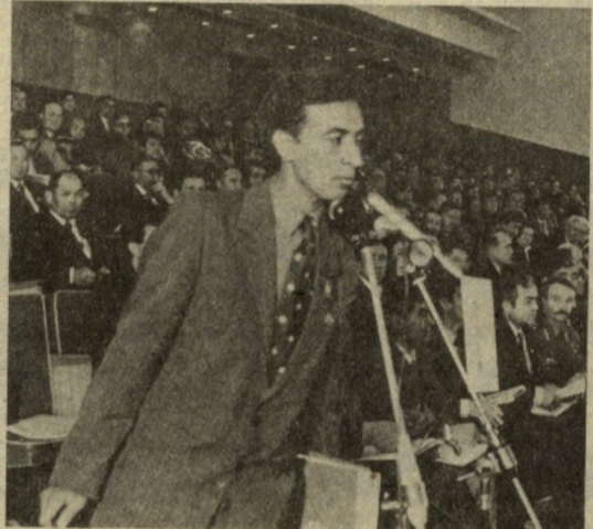
На снимке: в зале заседания.

Правда, есть опасение у части депутатов, что президентская власть может обернуться жесткой диктатурой. В наших силах сделать так, чтобы этого не случилось. Президент работает совместно с депутатами, с сессией, поэтому будет контроль.