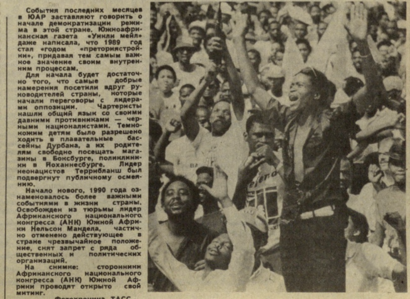
События последних месяцев в ЮАР заставляют говорить о начале демократизации режима в этой стране. Южноафриканская газета «Унили мейл» даже написала, что 1989 год стал «годом преториенской» революции, придавая тем самым важное значение своим внутренним процессам.