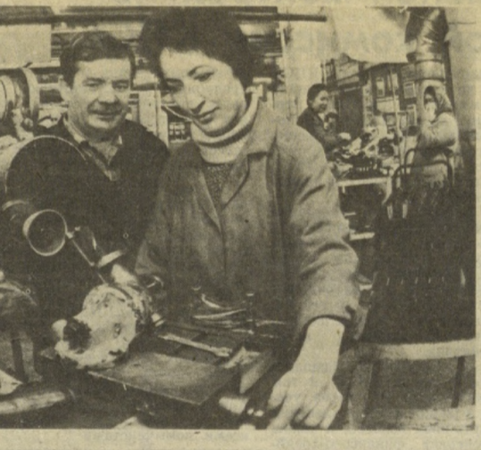
Ю. БОДАРЕНКО, корр. УзТАГ.

«Вариант» заключил договор с Министерством народного образования УзССР, располагающим квалифицированными кадрами. Пока же эксперты продумывают оптимальные варианты создания принципиально нового компьютерного языка, на «Варианте» заняты подготовкой машин для общеобразовательных программ. Заказ на этот год — создание в республике 2,500 новых компьютерных классов. Необходимо модернизировать машины и уже существующие. А их уже 1,100. Задача это вполне по плечу, считают на предприятии. Но свое предложение работники «Варианта» видят не только в производстве компьютерных классов, а и в воспитании новой компьютерной грамотности населения. На достаточно высоком уровне обеспечивает «Вариант» и сервисное обслуживание, которое включает обучение пользователей, 7-летнее обслуживание компьютеров специалистами, помощь и консультацию в составлении программ обеспечения. Не случайно надежность работы оборудования отмечают многие заказчики. Потому и высока сегодня репутация предприятия. Вот и сейчас «Вариант» получил заказку из Казахстана. Для создания клавиатур на казахском языке надо будет добавить еще 9 букв.