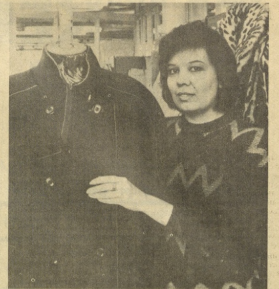
Текст и фото В. СИЯГИНА.

Продукция с маркой швейного производственного объединения «Красная заря» на прилавках не залеживается. Добрую славу выпускаемым здесь пальто для детей, подростков и взрослыхнискались высокое качество и оригинальность моделей, отвечающих самым высоким покупательским требованиям. Эти параметры достигнуты благодаря полной модернизации производства. Сейчас на фабрике завершается последний этап замены оборудования и машин. В этом процессе участвовало несколько ведущих фирм Англии, Японии, Испании, Франции и ФРГ. По оценке специалистов, уже сегодня многие изделия, а их на фабрике выпускается более 100 моделей, изготавливаются на уровне лучших мировых образцов.