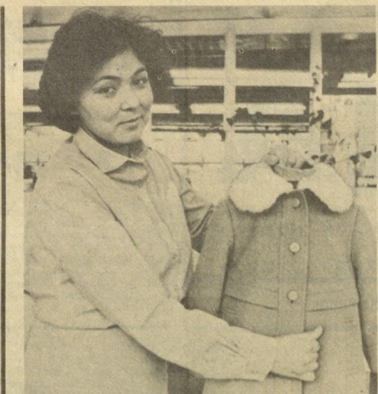
Текст и фото В. СИЯГИНА.

Продукция с маркой швейного производственного объединения «Красная заря» на прилавках не залеживается. Добрую славу выпускаемым здесь пальто для детей, подростков и взрослыхнискались высокое качество и оригинальность моделей, отвечающих самым высоким покупательским требованиям. Эти параметры достигнуты благодаря полной модернизации производства. Сейчас на фабрике завершается последний этап замены оборудования и машин. В этом процессе участвовало несколько ведущих фирм Англии, Японии, Испании, Франции и ФРГ. По оценке специалистов, уже сегодня многие изделия, а их на фабрике выпускается более 100 моделей, изготавливаются на уровне лучших мировых образцов.