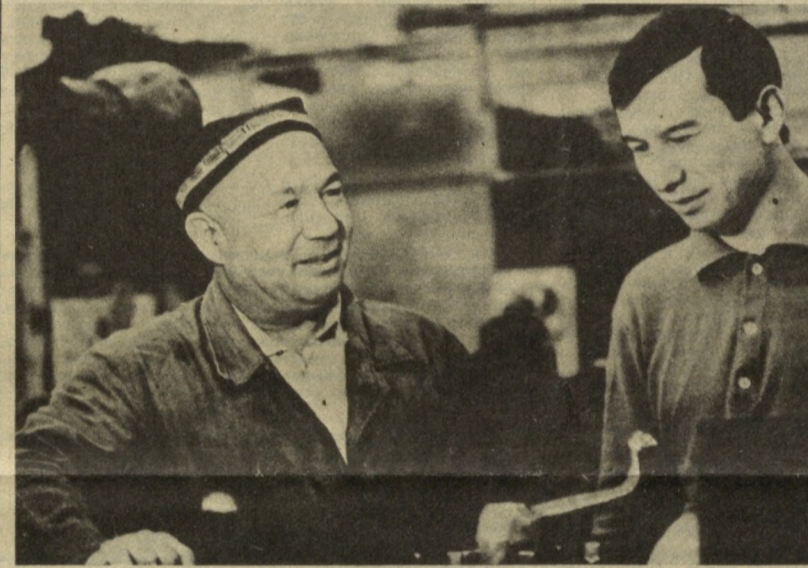
Ташкентский авторемонтный завод № 10 хорошо знает профессиональные автомобилисты столицы. Здесь выпускаются многие запчасти, и работают на заводе немало настоящих знатоков своего дела.

основе, предстоит стать выразителем интересов как непосредственных производителей сельскохозяйственной продукции, так и всех, кто связан с продовольственным комплексом. Проект устава, который определит статус организации (в частности, быть ей общественной или общественно-политической), права ее членов, другие моменты, признано целесообразным опубликовать для широкого обсуждения. Он должен стать своего рода точкой отсчета на предстоящих собраниях трудовых коллективов, районных и межрайонных конференций по выборам делегатов учредительного съезда «Крестьянского союза СССР». (Корр. ТАСС) МОСКВА.