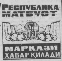
МАРКАЗИ ХАБАР ҚИЛАДИ

14 октябрь эрталабига республикамиз тайёрлов пунктларига 4.033.928 тонна пахта, шу жумладан 292.042 тонна ингичка толали пахта келтирилди.