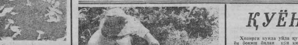
Куз манзараси.