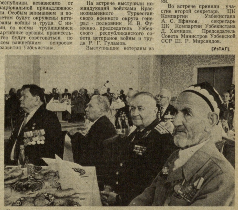
На снимке: во время встречи.

Населением получено из общественных фондов потребления выплат и льгот на сумму 2,142,7 миллиона рублей, что на 2,4 процента больше, чем в первом квартале прошлого года. С 1 января 1990 года выпущена до 70 рублей выплата ежемесячных пособий инвалидам с детства. С начала текущего года установлен порядок выплат пенсий в полном размере пенсионерам, продолжающим трудиться в качестве рабочих и мастеров, а также работающим инвалидам (независимо от размера заработной платы). Денежные доходы населения составили 6,3 миллиарда рублей и увеличились по сравнению с первым кварталом прошлого года на 17,5 процента. Темп прироста денежных доходов в 1,4 раза опережал темп прироста расходов населения на покупку товаров и оплату услуг.