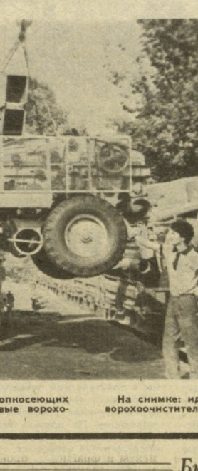
На снимке: идет отгрузка очередной партии верхоочистителей.

Чтобы остановить эту нежелательную тенденцию, чтобы найти среди беспартийных все большее число стоючих факторов при выдвижении кандидатов в руководящие органы городской партийной организации, состоявшейся затем голосования.