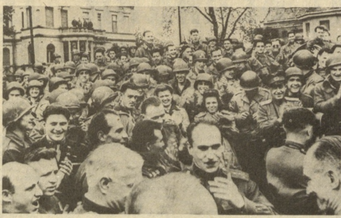
Встреча советских и американских солдат на Эльбе, в районе Торгау. 1-й Украинский фронт.