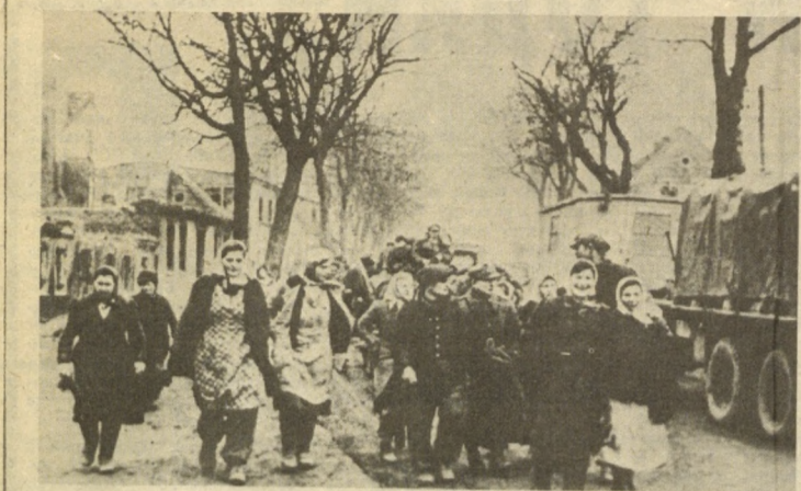
Польские граждане, освобожденные из немецкой неволи.