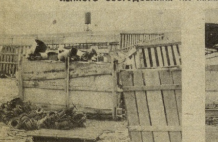
Материал «Как хозяйствуем, так и живем» читайте на 3-й стр.

НА ПРЕДПРИЯТИЯХ ОБЛАСТИ СКОПИЛОСЬ НЕУСТАНОВЛЕННОГО ОБОРУДОВАНИЯ НА МИЛЛИОНА РУБЛЕЙ