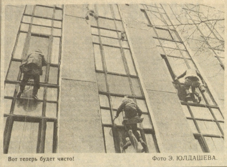
Вот теперь будет чисто!