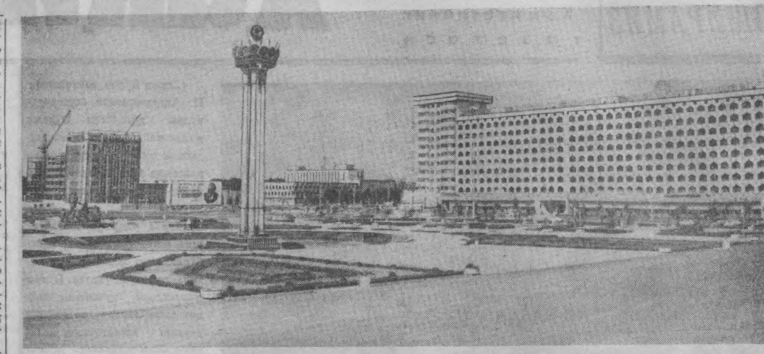
СУРАТДА: Тошкент шаҳридаги Халқлар дўстлиги майдонининг умумий кўришини.

Областиимиз харитасида яқин келайди, уни бир бошдан қўздаб ўтказайлик. Қўрама тоғларидан бошлаб азия Сирдарё этакларига янги саноат марказлари, қишлоқ шаҳарчалари қад кўтарган, ади йўллар курилан. Янгибор, Газалкент, Пискент, Калинин, Гўлбақор район марказларининг хар бири