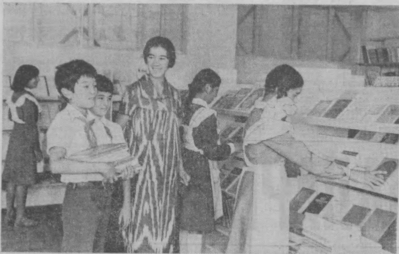
Тошкент область Калинин районидagi 45-мактаб кутубонасида машҳур ёзувчилар иқодида бағишланган конференциялар ва учрашулар

Зарафшон Қизилқумдаги сарвон сувини оқидини «қаттиқ» биебонда жовлашган шаҳар. Лекин шундай бўлса-да, у ҳақда гап кетганда гўзаллиги учун ҳақиқат равишда «Ортақларда ҳам учрамайди», дейишди. Шаҳарнинг диққатга сазовор жойларини эмас, балки унинг яшил лабоси — чаман-чаман гулзорлари, боғлари, ҳибонлари ҳам бу ерга келган ҳар бир киши эътиборини тортди. Келинг, шаҳарнинг Ленин проспекти бўйлаб бир сайр этайлик. Унинг иккала четиди ҳам дарахтлар кўнка буй чўзи, шаҳар ҳуснига-хуси кўшади. Дарахтларнинг тур- ли хиллиги диққатга сазовор. Саҳроларда янбарғил дарахтлар. Улар зарафшонликларини ҳар тарафдан қурша олган. Ленин проспекти ҳам, «Олтин водий» маданият уйи қаринидаги ҳибон ҳам, медицина комплексидан тортиб 8 йғи 6 ва 7-микрорайонлардаги муҳташам тураржой биноларини «Золотинка» пионерлар лагери ҳам дарахтзорлар бағрида. Ҳатто «Прогресс» спорт комплекси кўкаламзорлар бағрига бурканган... Зарафшон шаҳрини кўналомзорлаштиришда Николай Егорович Филимонов ва Василий Иванович Горюновларнинг ҳиссаси катта. Айни