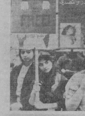
ЧЕХОСЛОВАКИЯ. Прагадаги АҚШ элчихонасини бонси олдига Исроил вахшиларининг Ливандаги ҳузур-хузурларига қарши студентларнинг порозлик намойишлари бўлиб ўтди. Унда Чехословакияда билим олаётган фалястинли ва ливандлик студентлар ҳам иштирок этишди. Намойиш қатнашчилари Исроил жаллоқдорларини ва унга хар томонлама ёрдам бераётган Оқ уй маъмурларини қаттиқ қораландилар ҳамда фалястин халқининг адолатли курашин билан

НЬЮ-ЙОРК. (ТАСС). Аргентина президенти Р. Бильево Оқ уйнинг АҚШ Президенти Р. Рейган билан учрашув тўғрисидаги таклифини рад этди, деб хабар беради «Нью-Йорк таймс» газетаси. Вашингтон маъмурияти бошлиқининг Лотин Америкасидаги бир қанча мамлакатларга ноябрь ойи охирига мўлжалланган сафарини чоғида шундай учрашув қўлда тутгани эди, деб ёзади газета.