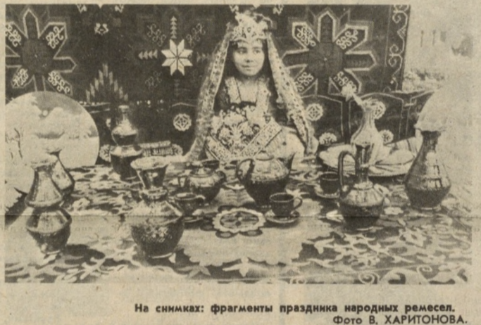
На снимках: фрагменты праздника народных ремесел. Фото В. ХАРИТОНОВА.