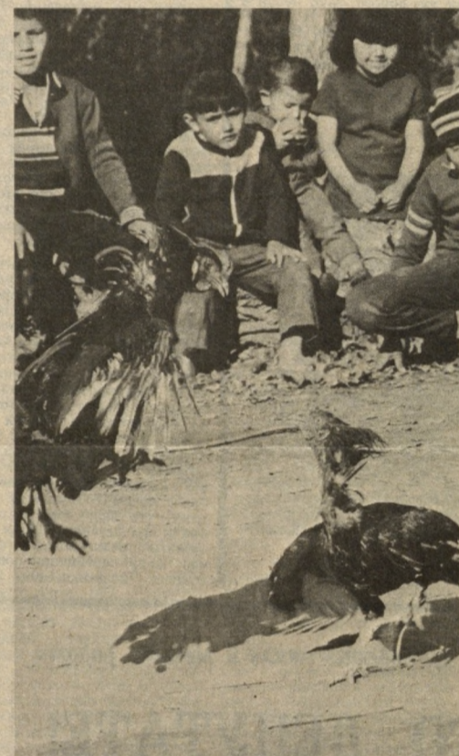
Петушьи бои.

Такой вот он нынче футбол в первой лиге: непредсказуемый, кипарисный, сюрпризный... З. АВАНЕСОВ, спортивный обозреватель «Ташкентской правды».