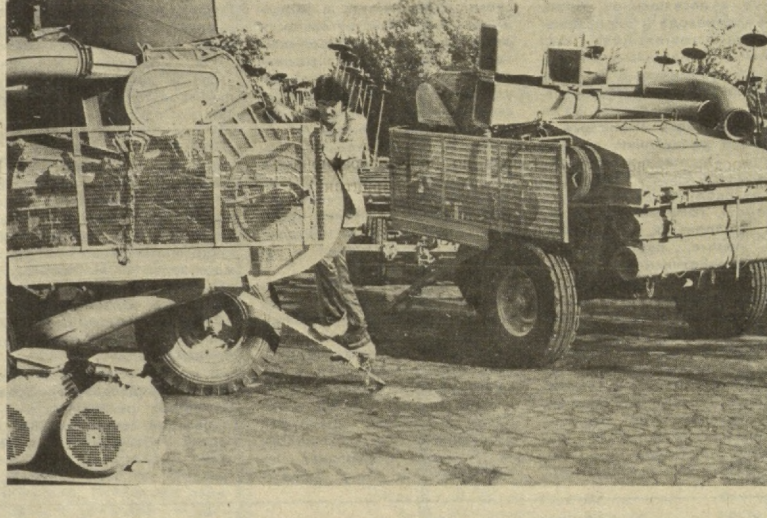
На полях Ташкентской области зреет в этом году неплохой урожай хлопка. Земледельцы возлагают большие надежды на технику — при умелом использовании урожай будет высоким...

Сколько будет стоить завтра прокормиться! Если мы и готовы подтянуть ремни, то гарантирует ли повышение цен выход нашего сельского хозяйства из кризиса? Да и в кризисе ли оно, из которого можно выбраться, или в тупике, когда для спасения требуется крутой разворот? Не потону ли и вновь измученные миллионы в трясине нынешней системы производства продовольствия?