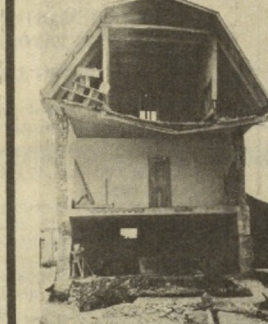
«Гнезда» — для стройдеталей

Контейнер, в котором уместятся сотни строительных деталей, изготовлен на Ташкентском экспериментальном комбинате объемного домостроения. Размером он сравнительно невелик: в ширину и высоту по полтора метра, в длину — три метра. Но для каждой детали, будь то плинтус, дверная рама или стекло, здесь предусмотрено свое «гнездо». Количество деталей в комплекте рассчитано на каждую из квартир подъезда девятиэтажного дома. Общий вес груза — более тонны.