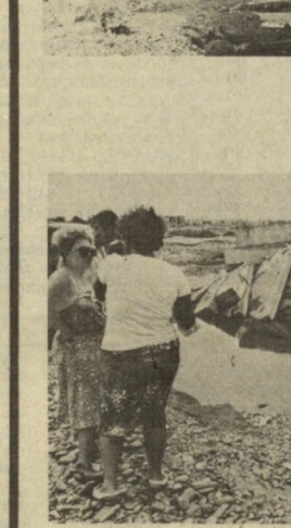
Публикация статьи «Бедствие Стихийное?» («П» от 23 мая), в которой рассказывалось о наводнении в Пенкентском районе, разрушившем десятки дачных участков ташкентцев, мы, признаваясь, рассчитывали, что она вызовет определенный интерес. Не только у читателей, но и тех организаций и ведомств, от которых зависит решение затронутой газетой проблемы.

— Так это же и есть самый настоящий клуб избирателей, за создание которого выступает наша газета. Чтоб жил он не только в период избирательной кампании, а был постоянным рабочим органом. — Мы сейчас намерены пойти еще дальше. Пробуем подключить неформалов к работе постоянно действующего депутатского комитет. Это же наши помощники. В комитет по межнациональным отношениям районного Совета, в которой я работаю как депутат, будут рады деловым, конструктивным отношениям с неформалами. Беседовал М. ГУРАЛЬСКИЙ.