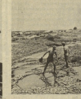
Возвращаясь к напечатанному

Опытный контейнер изготовлен по проекту рационализаторов предприятия в ремонтно-механическом цехе. До конца года намерено выпустить до полусотни таких емкостей. Тем самым потребность комбината будет удовлетворена.