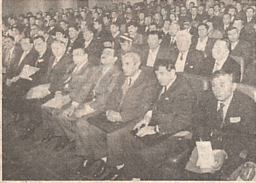
СУРАТЛАРДА: Қурултойдан лавҳалар.

Тошкентда Ўзбекистон «Адолат» социал- демократик партиясининг таъсис Қурултойи бўлиб ўтди. * * * В Ташкенте прошел учредительный съезд социал- демократической партии Узбекистана «Адолат».