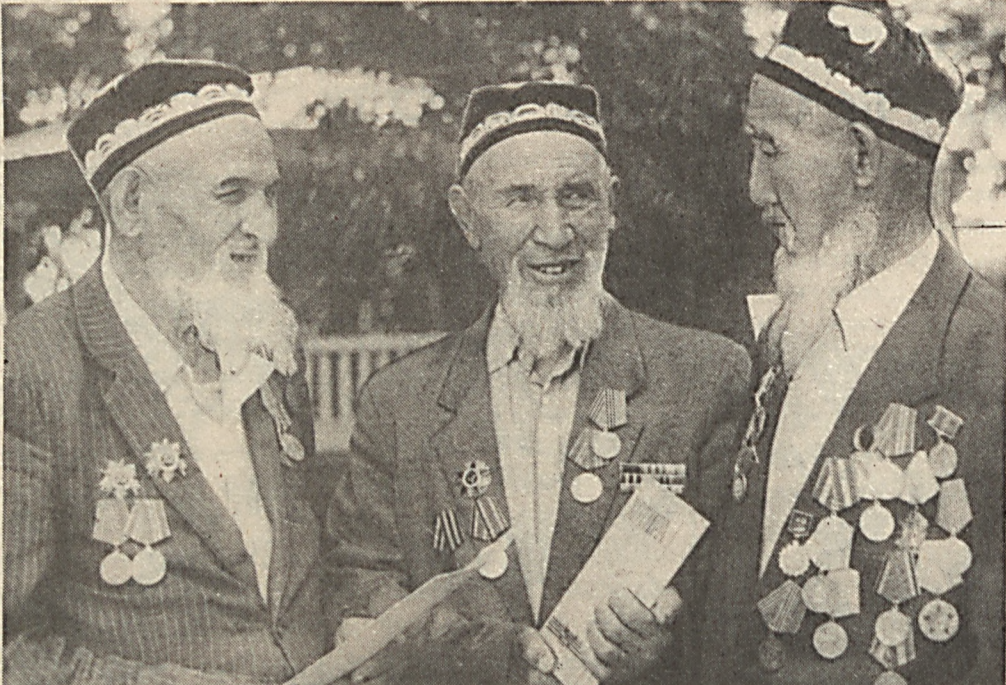
Ғалабанинг 50 йиллиги арафасида республикамиз Президенти имзо чеكкан «Ғалабанинг 50 йиллиги» мелодия Кизирки туманининг бир гуруҳ уруш фахрийлари ҳам сазовор бўлишди.

Узининг байналмиъл бурчини шараф билан бажарган ўзбек халқи ғалабага улкан ҳисса қўшди. Ўзбекистон уруш йилларида давлатга 3 млн. 806 минг тонна пахта, 54067 тонна пилла, 1 млн. 282 минг тонна лон, 48200 тонна сабзавот, 57444 тонна мева, 36 минг тонна мева қоқи, 159 минг тонна гушт, 22300 тонна жун ва бошқа маҳсулотлар етказиб берди.