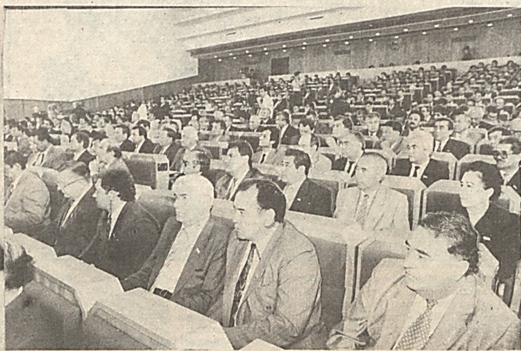
Суратда: сессия залида.