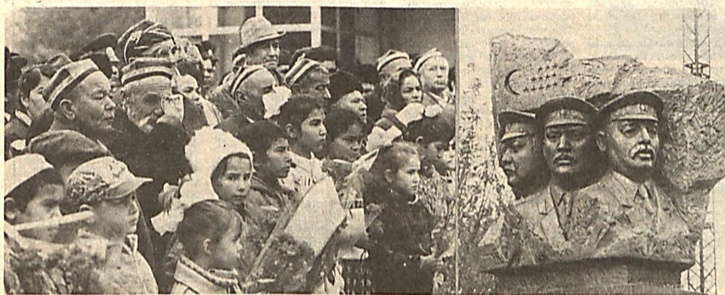
На снимках: во время церемонии открытия монумента; памятник трем героям.

Сотрудниками по борьбе с незаконным оборотом наркотиков проведены соответствующие мероприятия на вокзалах, автостанциях, в местах предполагаемой концентрации лиц,