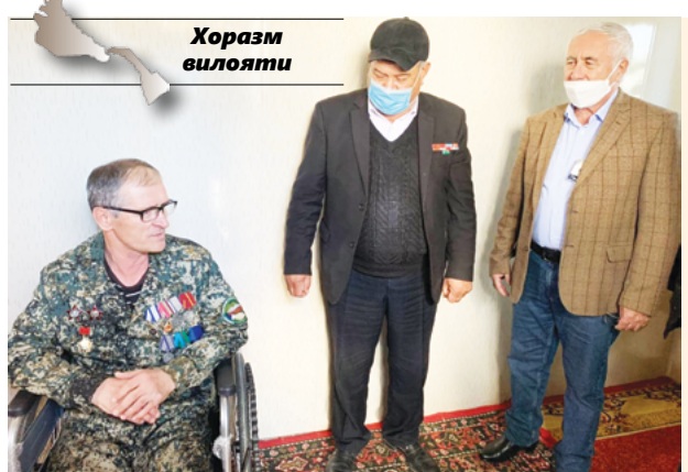
Хоразм вилояти Афғон урушида хоразмлик 3056 нафар йиғит иштирок этиб, жанг майдонларида 79 нафари ҳалок бўлган. 1280 нафари жаҳодат олиб қайтган. Улардан 350 нафари турли йилларда оламдан ўтган.