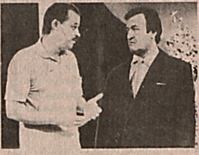
Мен кинони ёмон демоқчи эмасман. Узим ҳам кўпга...