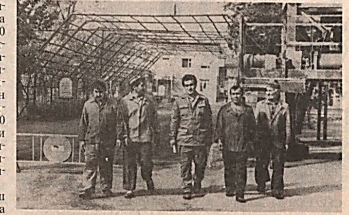
Жамоа аъзоларининг бир гуруҳи мароқли меҳнатдан сўнг тушликка отланишмоқда.

Бозор иқтисодиётига босқичма босқич ўтишни муним шартларидан бири — кам ишчи қуви сарфлаб, кўпроқ маҳсулот ишлаб чиқаришни йўлга қўйишдан иборатдир.