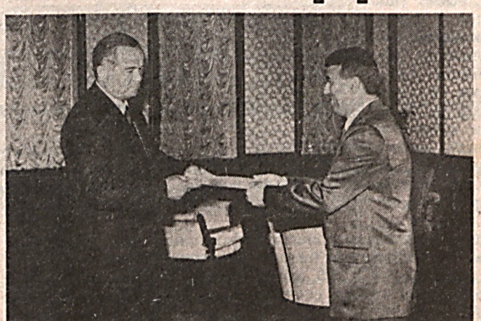
Ўзбекистон раҳбари Тожикистондаги вазият ҳақида фикр билдирар экан, экстремизмдан воз кечиб, муро са йулини излаш, БМТ, ЕХТТ каби халқаро ташкилотлар кумагида тинчлик ва барқарорликка эришиш сиёсий тангликдан чиқишнинг бирдан-бир йули эканини таъкидлади.

Президент Ислам Каримов Вальтер Зигльни Ўзбекистон заминига ташрифи ва юксак вазифага тайинлангани билан самимий қутлади.