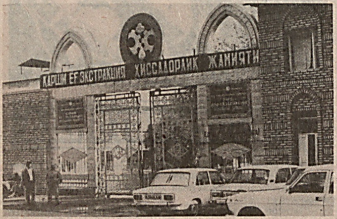
Корхонага шу дарвозадан кирилади.

яна 15 киши янги ишга жалб қилинади. Корхонамизда кўшимча равишда шифобахш сув ишлаб чиқариш таъминланади.