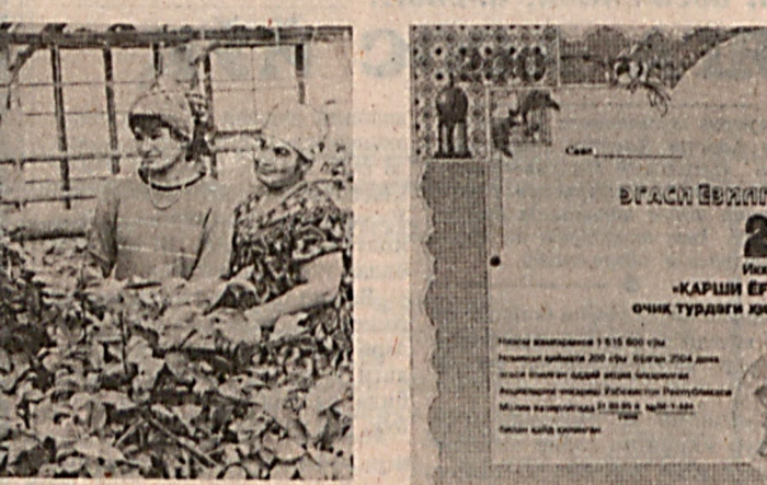
Корхона АҚЯсидаги намуна.