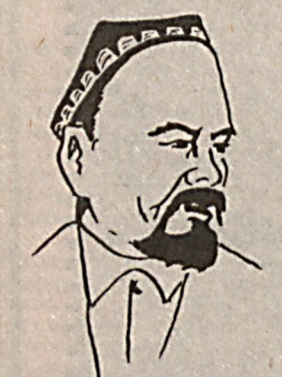
Юсуфжон КИЗИК ГУШТИ СИЗНИКИ

Кулги кирган ҳар бир хонадондан гам-ташвиш, уруш-жанжал, гийбат-бухтон, дарду алам қочади.