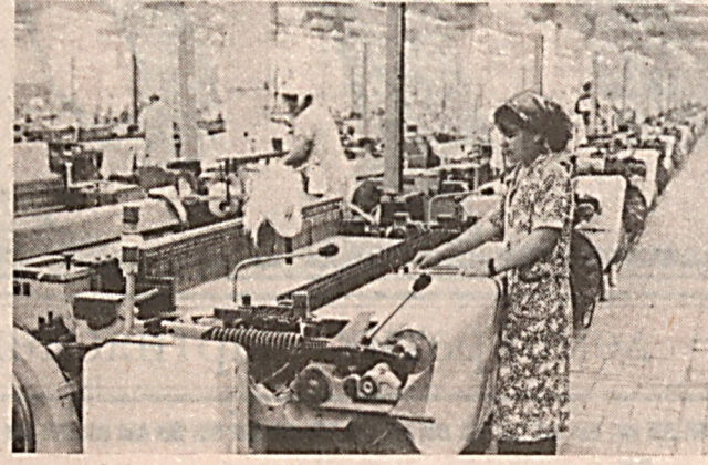
Хар бир шахс меҳнат қилиши, эркин касб тинлаши, алоқаларини шартларидан ишдан ва қонунда кўрсатилган тартибда ишсизликдан ҳимояланиши ҳуқуқига эга...