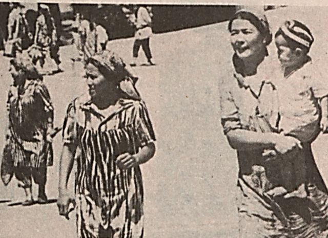
Оналик ва болалик давлат томонидан муҳофаза қилинади.