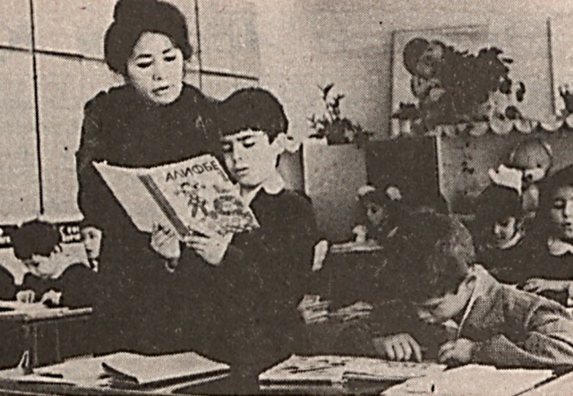
Хар ким билим олиши ҳуқуқига эга. Бепул умумий таълим олиши давлат томонидан кафолатланади.