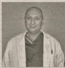
– Мазкур муассасада юқори технологик жаррохлик амалиётлари ўтказиш учун керакли шарт-шароитлар яратилган, – дейди И. Сенева номидаги Биринчи Москва давлат тиббиёт университети торакал хирургия ва фтизиопульмонология кафедраси мудири, тиббиёт фанлари доктори, профессор Дмитрий Гиллер . – Мамлакатингиз, хусусан, Республика ихтисослаштирилган фтизиатрия ва пульмонология илмий-амалий тиббиёт маркази хирурглар жамоасининг билими ва тажрибаси ҳам алоҳида эътирофга муносиб. Бунга бир неча йиллардан буён ҳамкорликда иш олиб боришимиз жараёнида гувоҳ бўлганман. Ушбу муассасада амалга оширилаётган мураккаб, юқори технологик операциялар, нафақат Ўрта Осиё, балки Хитой, Ҳиндистон ва бошқа тиббиёти ривожланган айрим мамлакатларда ҳам қилинмайди. Бугунги жаррохлик ама-

жумладан, Ўзбекистонда ҳам сил касаллиги энг юқори даражага эпидемиологик кўрсаткичларга кўпайган. Хусусан, ҳар 100000 аҳолига касалланиш кўрсаткичи 79 ва ўлим кўрсаткичи 12,3 ташкил этган. Хозирги кунга келиб бу рақамлар кескин камайди, яъни касалланиш 44,6 ва ўлим кўрсаткичи эса 2,7 гача тушди. Давлатимиз томонидан берилётган эътибор натижасида беморлар барча дори-дармонлар билан таъминланмоқда. Шунга ҳам алоҳида таъкидламоқчиманки, Ўзбекистонда силни ташхислаш ва даволаш бепул амалга оширилади. Айтиш жоизки, сил бедаво эмас, қачонки ўз вақтида аниқланиб, тўлиқ даволашни борила. Бугунги ўтказилган операциялар мураккаб ҳисобланиб, бири 8 ёшли туғма нуқсонлари мавжуд болада бажарилди. Яъни, кўкрак қафаси ва бўйин соҳасида жаррохлик амалиёти ўтказилди. Бу жуда мураккаб, сабаби бир пайтнинг ўзида икки тана аъзосида амалга оширилмоқда. Навбатдаги 64 ёшли беморда чап ўпканинг пастиги бўлганда сил ҳароатини консерватив усул билан даволаб кўрилганидан сўнг қутилган натижага эришиб бўлмади. Чандиқ қавак пайдо бўлгани учун каминвазиз видеоторакокопик, яъни юқори технологик жаррохлик усулида олиб ташланади. Бу жараёнда вилоятларда фаолият юритаётган торакал жаррохлар ҳам иштирок этгани уларнинг истиқболдаги амалиётида кўп қилишга ишончим комил.