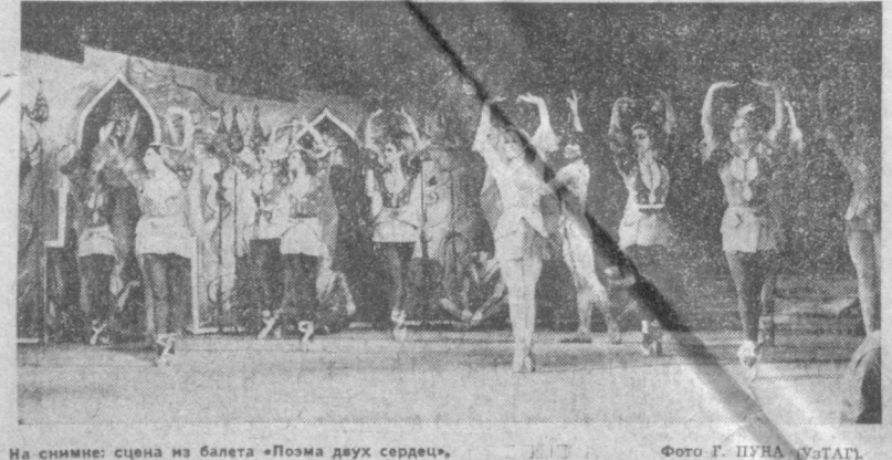
На снимке: сцена из балета «Поэма двух сердец».