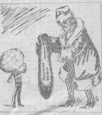
Зловещий подарок дяди Сэма.

Заседание правительства в Токио было посвящено экономии и проведению реформы в закрытых районах.