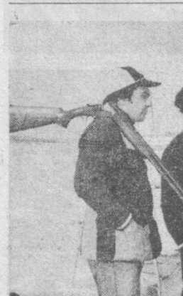
Сборная команда Узбекистана по стальной стрельбе начала подготовку к Спартакиаде на уровне СССР...