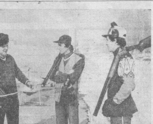
Сборная команда Узбекистана по стальной стрельбе начала подготовку к Спартакиаде на уровне СССР...