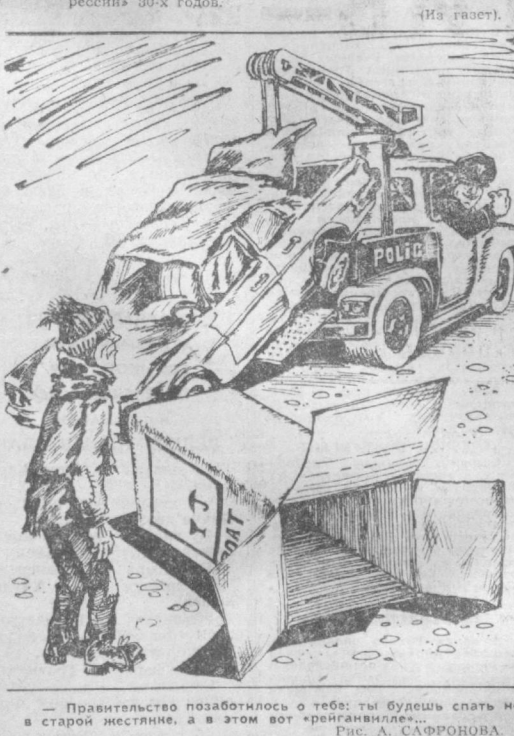
Рис. А. САФРОВА.

По данным национальной комиссии по делам бедствия Нью-Йорка, в Соединенных Штатах в настоящее время не имеют крыши над головой до 2 миллионов человек. Это результат экономической политики администрации Рейгана, приведшей страну к самому глубокому экономическому спаду со времен «великой депрессии» 30-х годов.