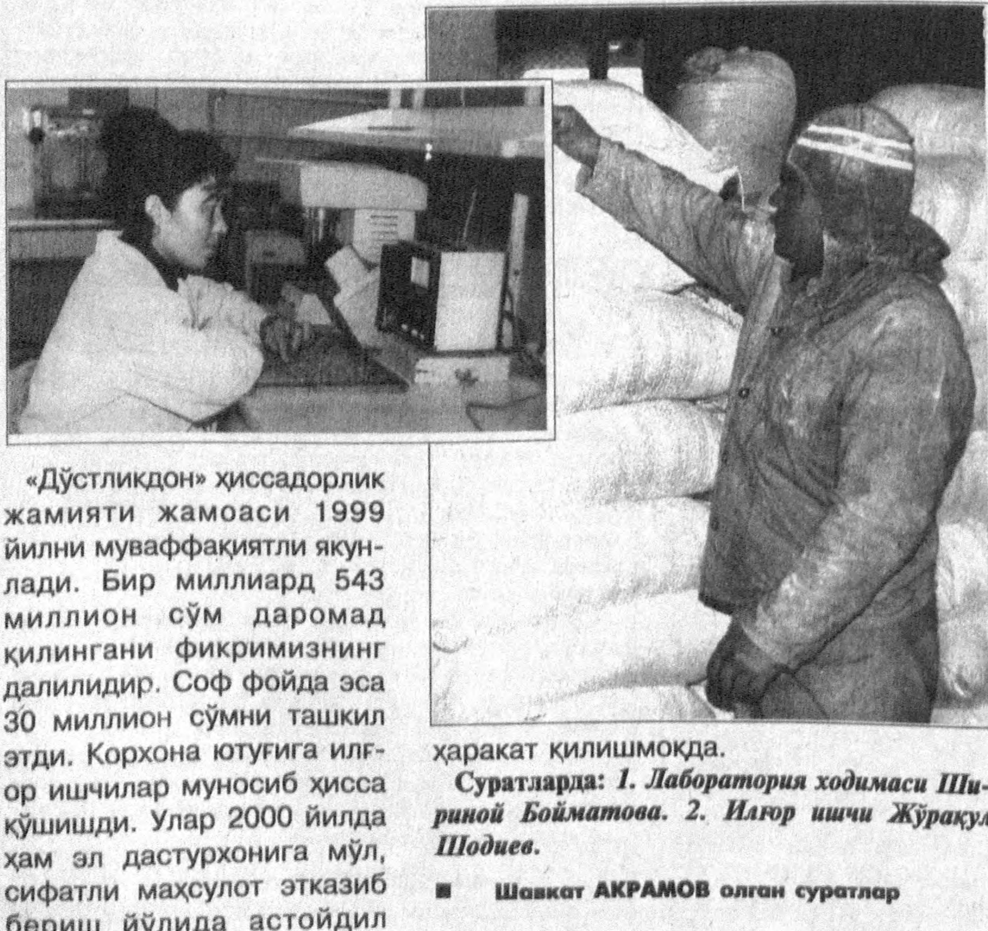
«Дўстликдон» хиссадорлик жамияти жамоаси 1999 йилни муваффақиятли якун-лади. Бир миллиард 543 миллион сўм даромад қилинган фикримизнинг далилидир. Соф фойда эса 30 миллион сўмни ташкил этди. Корхона ютуғига ил-ғор ишчилар муносиб ҳисса қўшишди. Улар 2000 йилда ҳам эл дастурхонига мўл, сифатли маҳсулот этказиб бериш йўлида астойдил ҳаракат қилишмоқда.

Ўзбекистон ҳам Россияда-ги ўқшаш — албатта сал бошқача даражада — бир му-аммога дуч келмоқда: ҳозир барчага бериб қўйилган му-лақ эркинлик мамлакат ич-қарисиди ва хорижгаги ай-рим носоголом кучларнинг ҳам «қўлини ечиб» юбормоқ-да. Шунинг учун ҳам ҳозир-нинг ўзидаёқ иккала раҳбар-га бир хил айб қўйилмоқда: Владимир Путин ҳозирнинг ўзидаёқ диктатура ўрнат-ишда айбланиб улгурди, Ислом Каримовга нисбатан қўлла-нилаётган «Каримовнинг то-талитар тузуми» деган ибора эса, оладга айланб қолган. Давлатни, аниқроқ қилиб