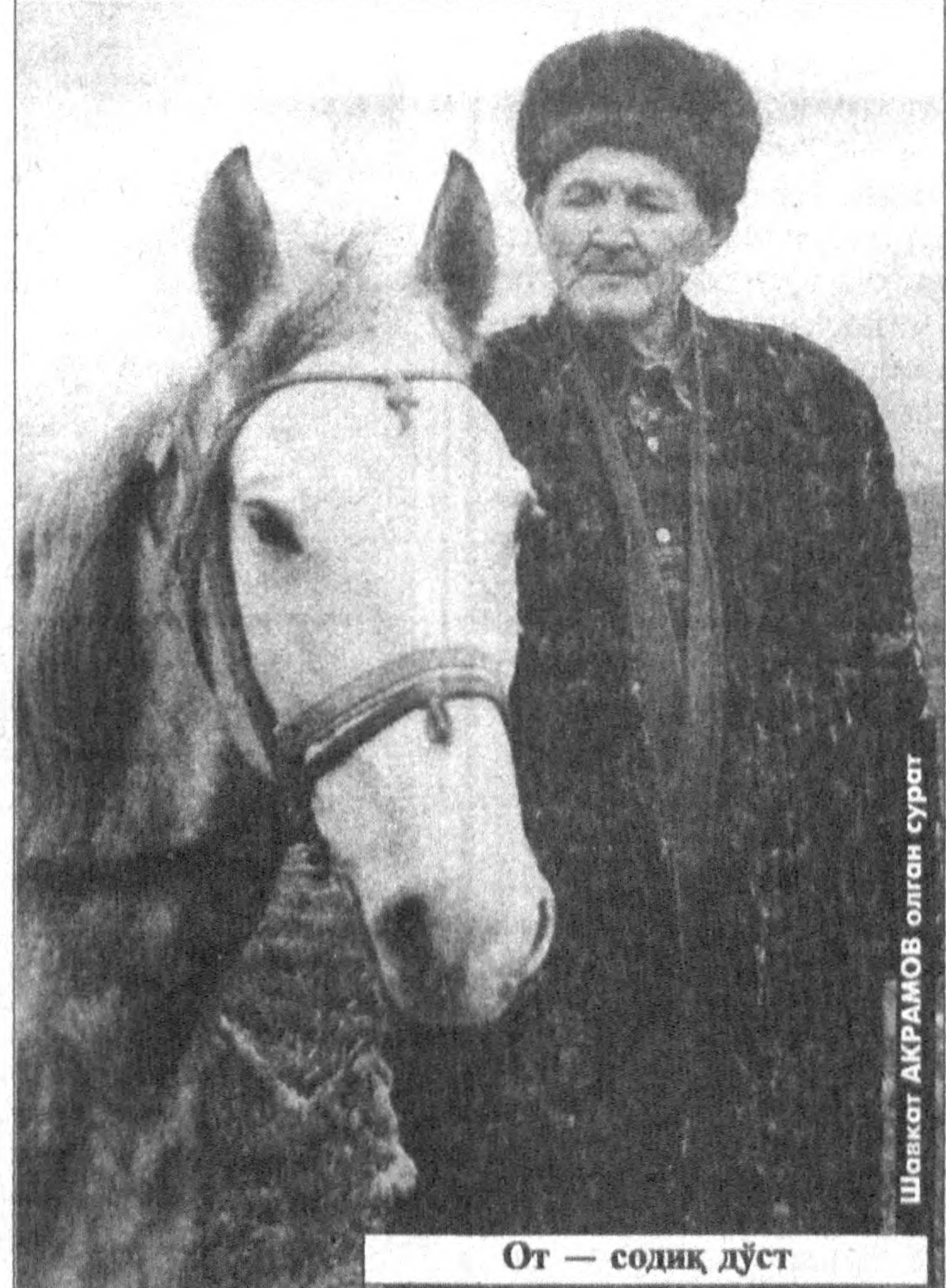
От — содиқ дўст

аъзоларининг умумий сони жорий йилнинг бошига келиб, 530 минг нафарга етганда кўришимиз мумкин.