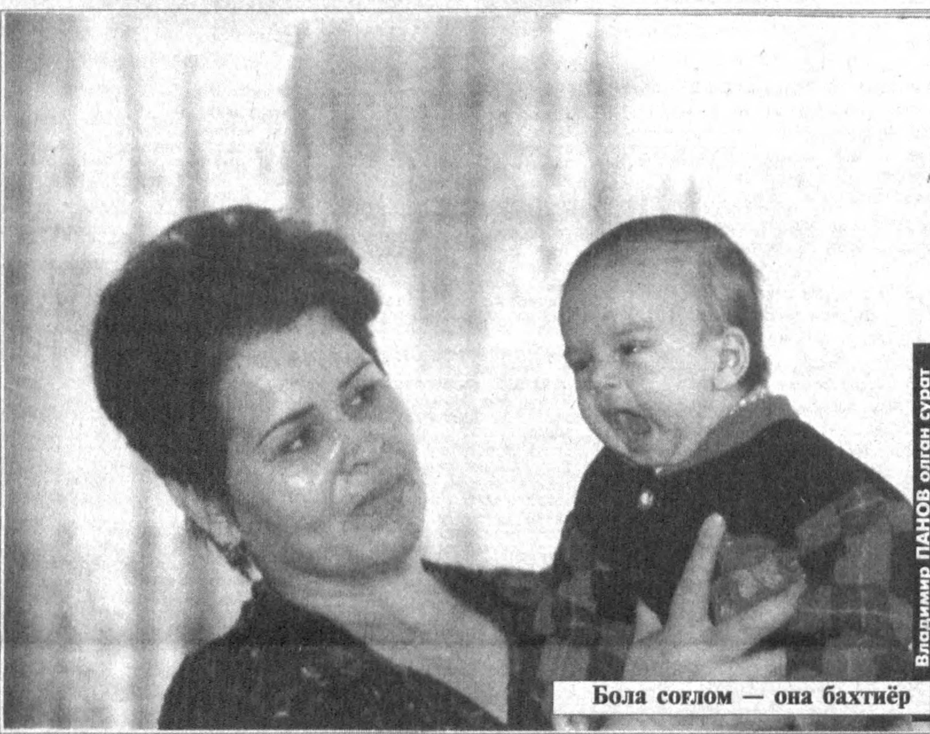
Бола соғлом — она бахтиёр