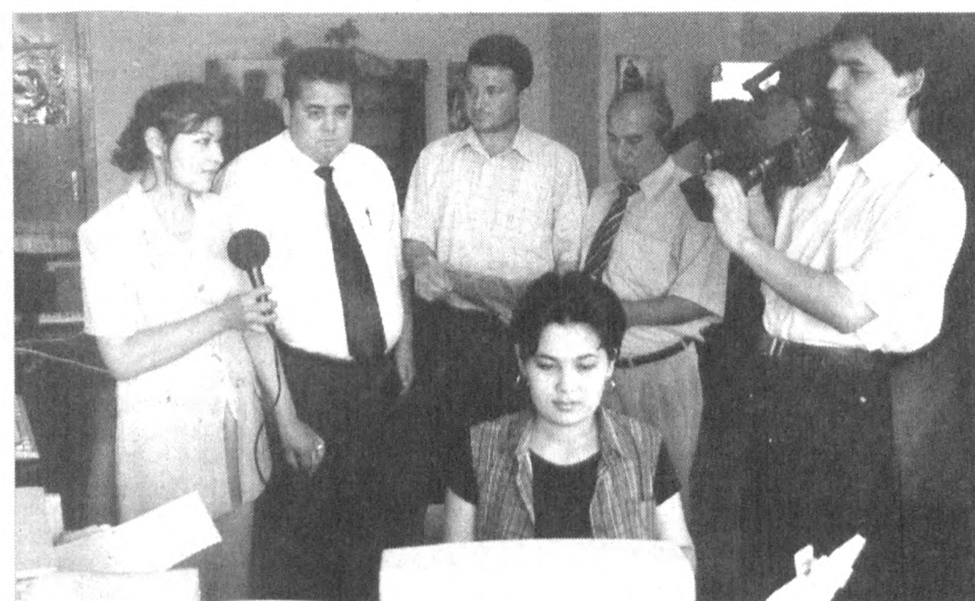
Газетамизнинг навбатдаги сони чоп этилаётган пайтда, «Ассалом, Ўзбекистон» телестудияси ижодкорлари тахририятимизга таширф буюришди.