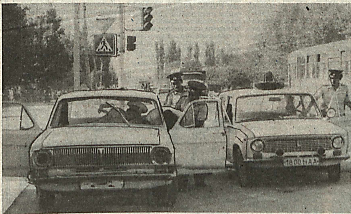
Наш общественный корреспондент Негматжон Маматжанов сделал этот снимок в момент задержания сотрудниками ГАИ УВД Наманганского облхокимията угонщика автомашины.

Президент Республики Узбекистан И. А. Каримов в связи с первой годовщиной провозглашения независимости Республики Узбекистан, проявив милосердие и гуманность, подписал указ об амнистии лицам, совершившим преступления по неосторожности, либо преступления, не представляющие опасности для общества.