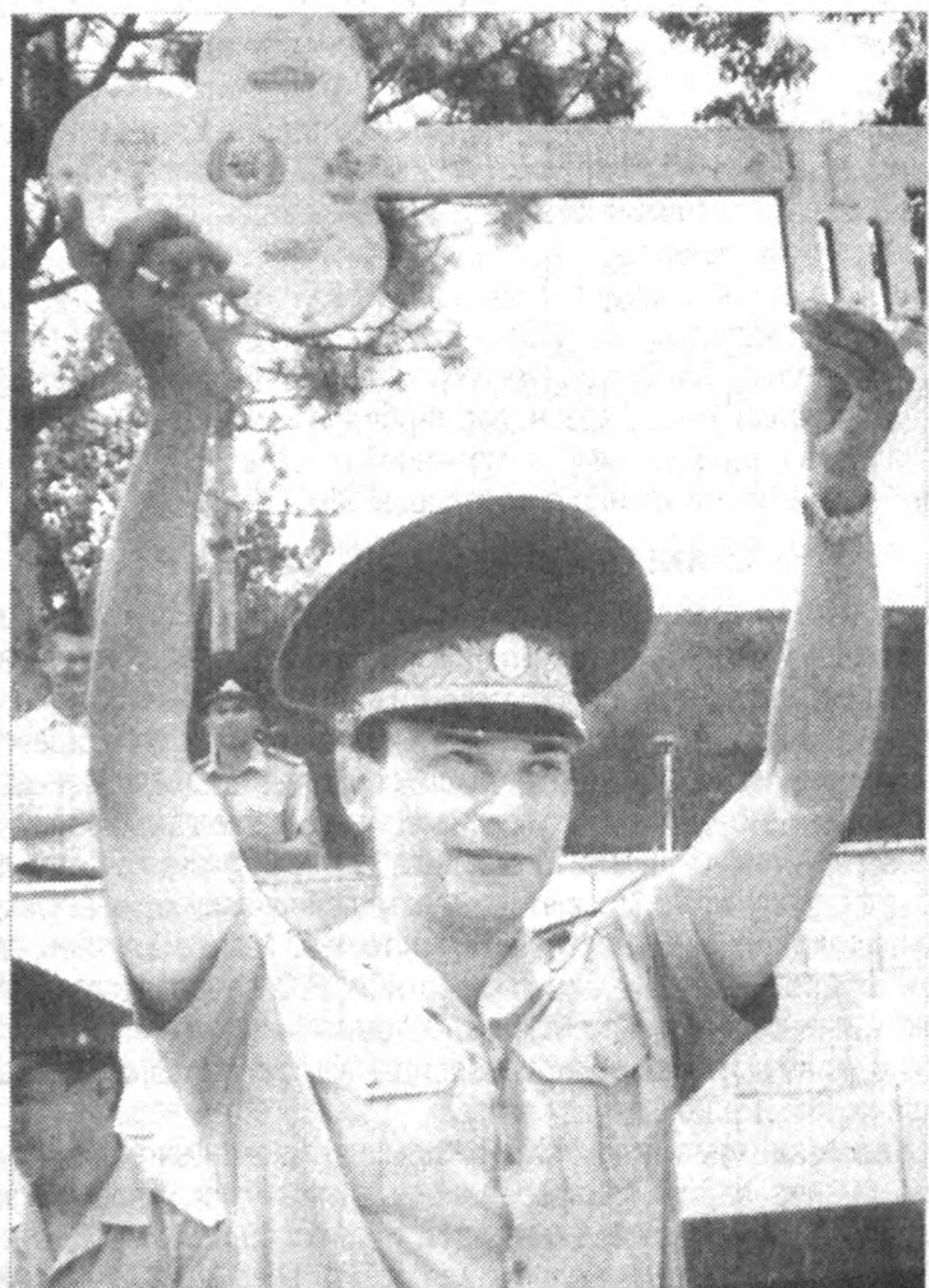
Ватан ҳимояси — олий шараф

■ 2003-YIL ■ 10-IYUL ■ PAYSANBA ■ 81 (27.101) ■ uzbovozi@sarkor.uz ■ 1918-yil 21-iyundan chiqqa boshlagan.