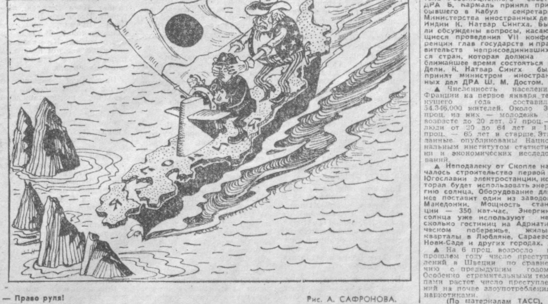
— Право руля! Рис. А. САФРОНОВА.

планируют в Пентагоне, разделить с США роль империи в Юго-Восточной Азии и районе Тихого океана. (Из газет.)