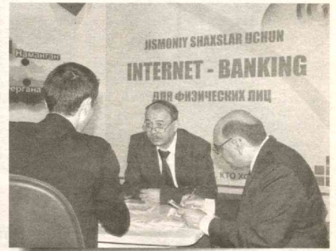
Кўргазма тажриба алмашиш, компаниялар ўртасида ҳамкорлик алоқаларини ривожлантириш, шу ернинг ўзига шартномалар имлолаш имконини ҳам берди.