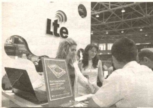
Энг сўнги ишланма ва хизматлар намоиши. Булар қаторига МДХ давлатлари орасида биринчи бўлиб мамлакатимизда йўлга қўйилган LTE – туртинчи авлод тармоғини қўйиши мумкин.