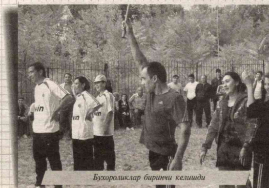
Бухоролликлар биринчи келишди