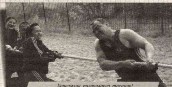
Хоразмлик полвонларга тасанно!