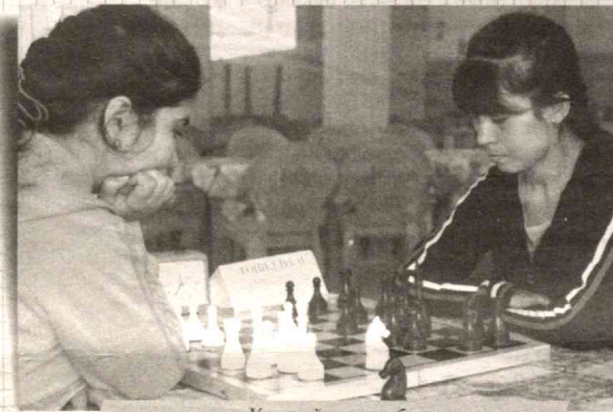
Учинчи ўрин учун баҳс