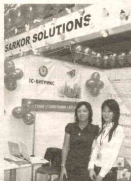
Веб-дастурлаш соҳаси вакиллари ҳам ўз хизматларини намоиш қилмоқдалар.