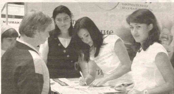
Баркамол авлод йилида ўқув даргоҳларини ZyuNET тармоғига улаш давом эттирилади. Шу ва бошқа янгиликлар хусусида UZINFOCOM стендида батафсил маълумот берилди.