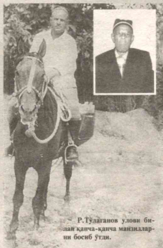
Р.Тўлаганов улови билан қанча-қанча манзилларни босиб ўтди.

Ўша даврларда газета-журналларни, хат, телеграмма ва жўнатмалар-