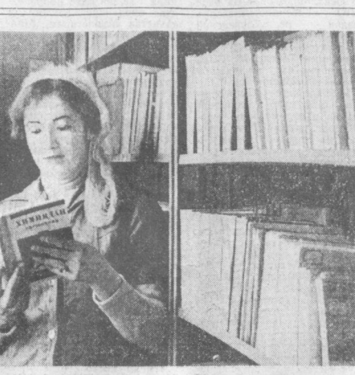
В коллективе работников Шахриханской шелкоткацкой фабрики имени XXV съезда КПСС Андижанской области...

туристских организаций Венгрии, ГДР, Польши и Чехословакии... Представители туристских организаций социалистических стран, находящиеся в Ташкенте, организовали тематическую выставку «Встреча друзей».