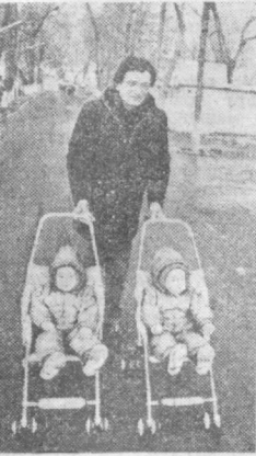
На прогулке.

Мультипликация — это искусство, которое создается в творческой конференции, состоявшейся на днях в Ташкенте. В ней приняли участие сотрудники мультипликационной студии «Узбекфильм» и представители Госкино СССР.