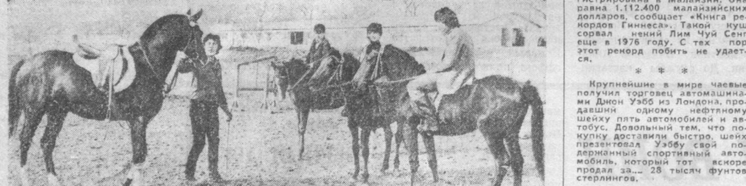
Преимущественно конной чистокровной карабахской породы разводят на ташкентском конном заводе, расположенном в Ахангаранском районе. Главная задача завода — разведение и реализация племенных лошадей.

Вотам обещает быть нынешний год для ташкентских любителей искусства. На гастроли к нам собираются ансамбли, напевали, солисты. Девиз выступления: «Ташкент — город мира и дружбы».