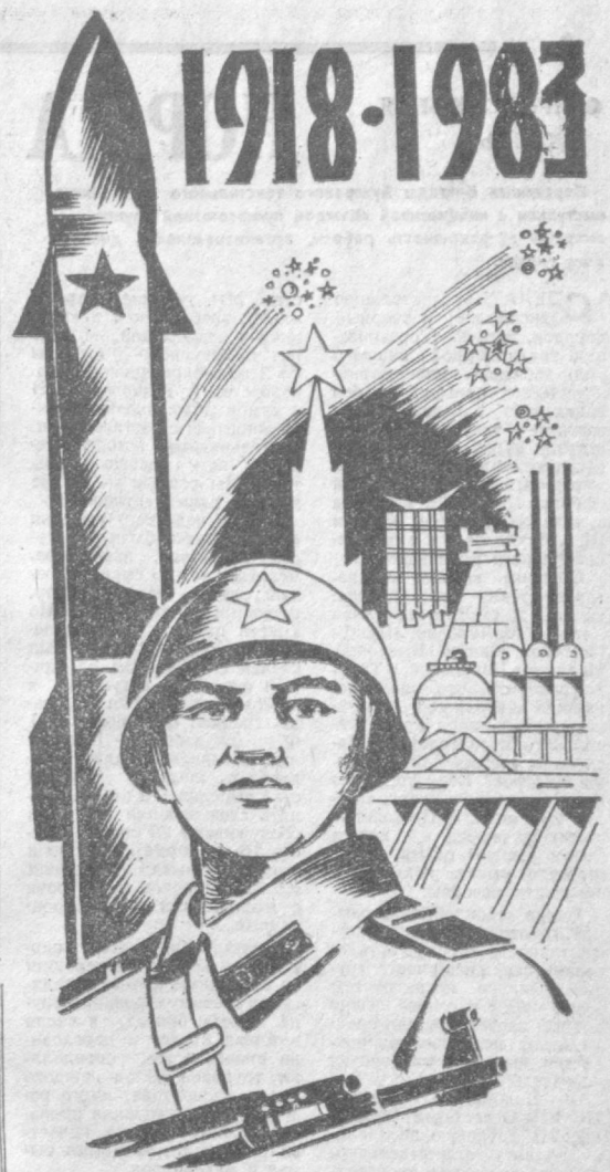
Глеков А. ХАЛИКОВА.

▲ Повысить точность топографических карт Антарктиды помогли ученые Львовского политехнического института. Разработанный ими метод геодезических измерений предназначен специально для высоких широт. Он позволяет избежать погрешностей, возникающих из-за экстремальных погодных условий этого континента. (ТАСС).