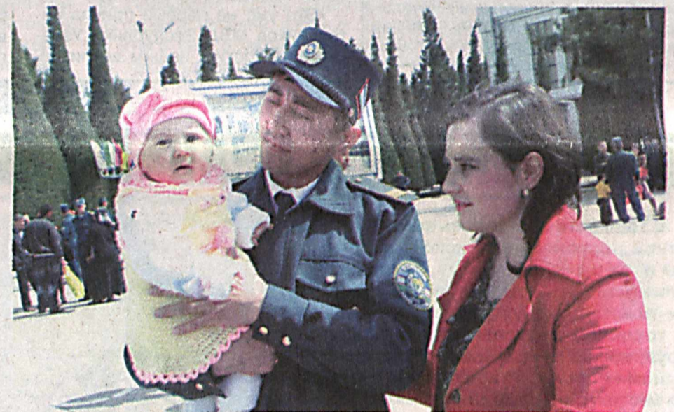
На снимках: моменты торжества.