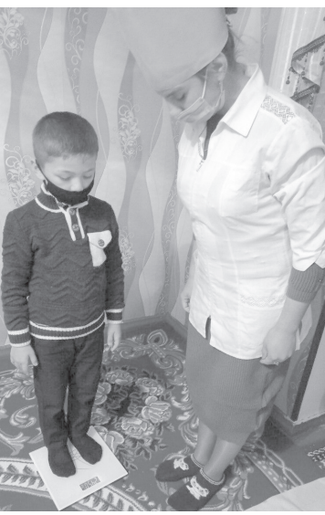
(Давоми. Боши 3-бетда).