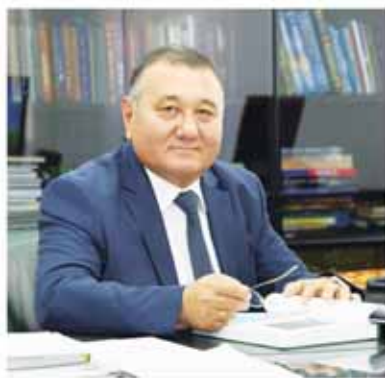
Кувондик САНАКУЛОВ, Олий Мажлис Сенати аъзоси, Ўзбекистон Қаҳрамони.

татбиқ этилаётгани комбинат раёнада янги имкониятларни яратмоқда.