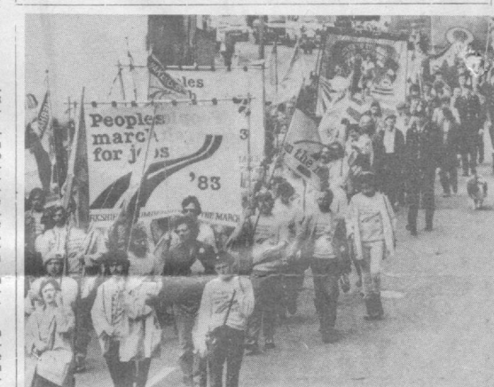
На Британских островах армия лишены права на труд, даже по явном заниженным официальным данным, насчитывает 3,2 миллиона человек. На снимке — участники «Марша за право на труд-83» на улицах Ноттингейма. (Фотохроника ТАСС).

● ОТКЛИКИ ПРЕССЫ: ГОЛОС МОСКВЫ ПРОИЗНАЧ ЧУВСТВОМ ВЫСОЧАЙШЕЙ ОТВЕТСТВЕННОСТИ ЗА СУДЬБУ МИРА ● КОНГРЕССМЕН ЭЛБОСТА: АМЕРИКАНЦЫ ПОТЕРЯЛИ ВЕРУ В СВОЕ ПРАВИТЕЛЬСТВО ● ПОДДЕРЖКА ПОЗИЦИИ СИРИИ ● ПОПЫТКИ РАЗЖЕЧЬ РЕЛИГИОЗНО-ОБЩИННЫЕ БЕСПОРЯДКИ