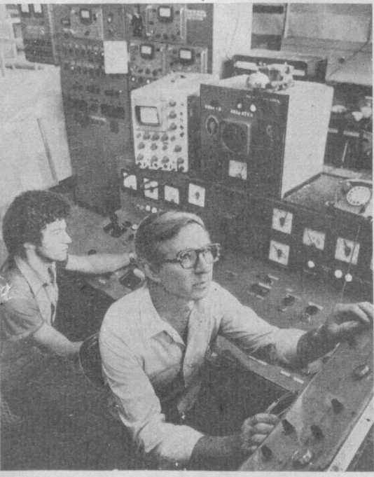
Фото и текст Г. ЛОРЕНЦА.

На наш взгляд, следует взять на учет все зеленые насаждения до одного дерева, до одного кустика, повысить ответственность садовников, комендантов, членов домоуправлений, муниципальных комитетов. Бухара может и должна стать зеленым городом, цветущим садом.