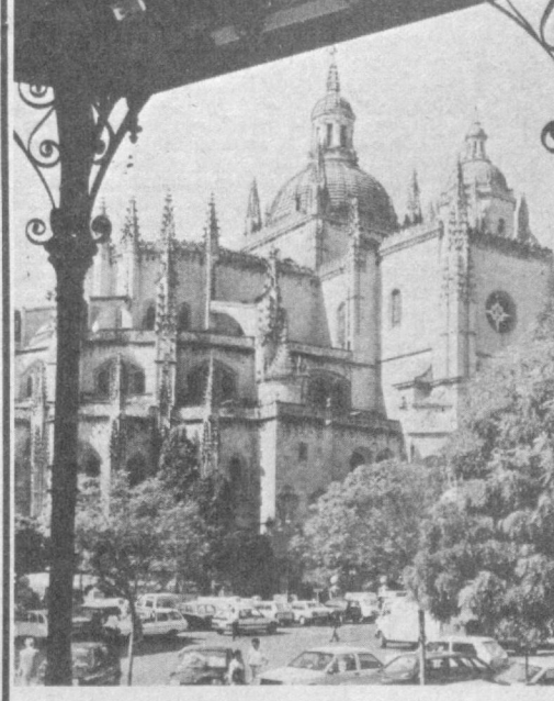
Сеговия — один из старейших городов Испании. Он хранит наследие двух культур: романской и мавританской. К достопримечательностям Сеговии относятся акведук — сооружение в виде моста с водоводом — внушительный памятник древнейших времен. Настоящим местом паломничества туристов в Сеговию является замок Алькасар, построенный еще в конце XI века. НА СНИМКЕ: уголок Сеговии.

За сохранение американских военных баз на Филиппинах высказался премьер-министр Малайзии Махатхир Мохамад. В интервью американской газете «Вашингтон пост» он заявил, что Соединенным Штатам пока рано изучать вопрос об уходе из этой страны, хотя региональная напряженность, как представляется, ослабла в результате мирных инициатив Советского Союза и обнадеживающих перспектив камбоджийского урегулирования.