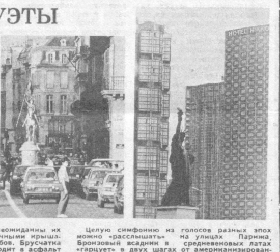
Современные города. Сильно неожиданны их силуэты! Над крупными черепичными крышами нависают громады небоскребов. Брусчатка древней мостовой вдруг переходит в асфальт современной автомагистрали. На фоне классических фасадов красуются скульптура в стиле «постмодерн». Кажется, разные века вступают в разговор на улицах западноевропейских городов.