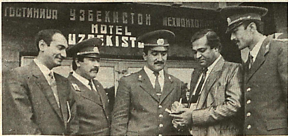
Обсуждаем проект Конституции