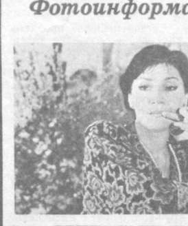
Народная артистка СССР Нани Брегадзе вышла впервые на сцену в 1956 году с эстрадным оркестром Грузинского политехнического института.