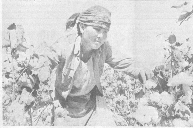
СУРХАНДАРЬИНСКАЯ ОБЛАСТЬ. Мастера ручного сбора вышли на поля совхоза «Набахор» Гагаринского района. Они собирают хлопок там, где трудно пройти машинам, кот...

К. ЦИКАНОВ. Соб. корр. «Правды Востока», Хорезмская область.